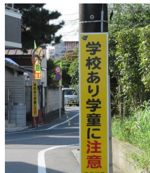
北小岩8丁目の通学路

暮らしのことなど、なんでもまずご相談ください。すぐに解決できないこともありますが、誠意をもって対応させていただきます。日本共産党都議団控室03(5320)7270